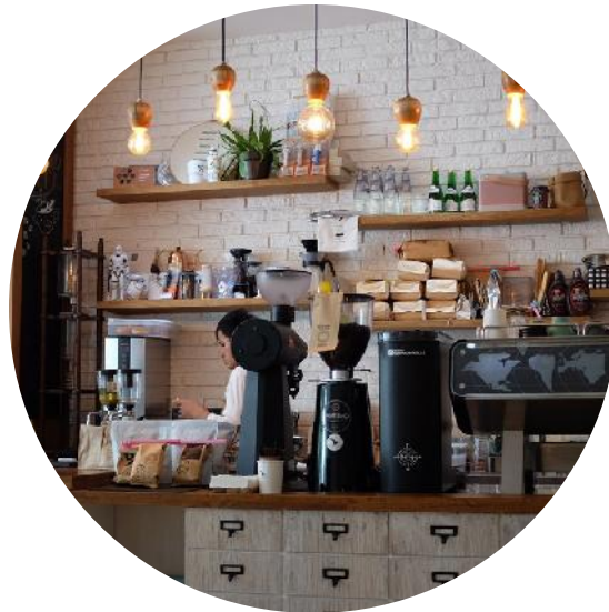
PYMES Y AUTÓNOMOS